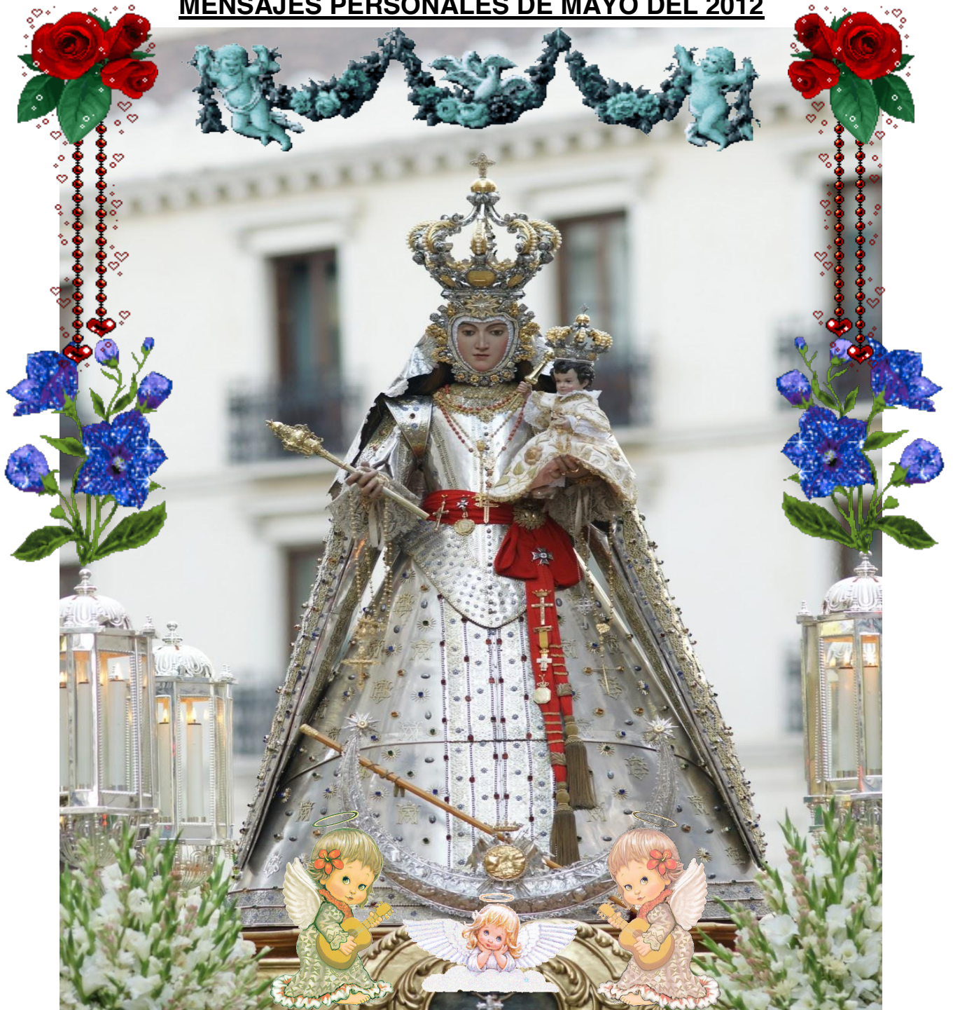
Nuestra Señora del Rosario de Lepanto (de Granada)

¿Qué nos podéis decir del 5º Dogma? Corredentora