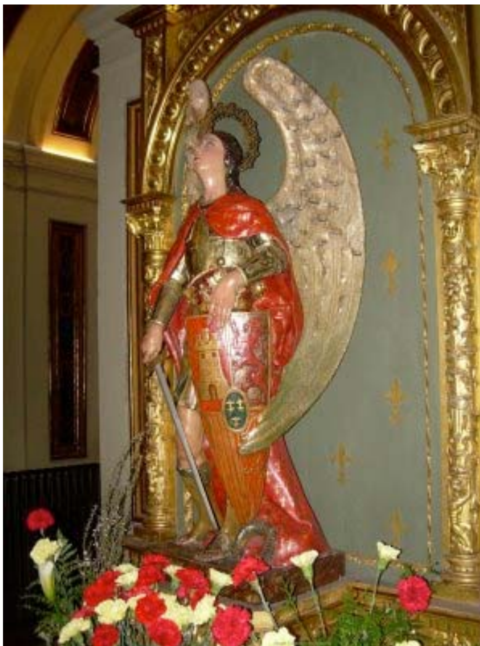
Santo Ángel Custodio de España

La Cruz Sagrada sea mi luz, No sea el Dragón mi jefe. Apártate Satanás; nunca me aconsejes tus vanidades, la bebida que me ofreces es el mal; bebe tú mismo tus venenos.